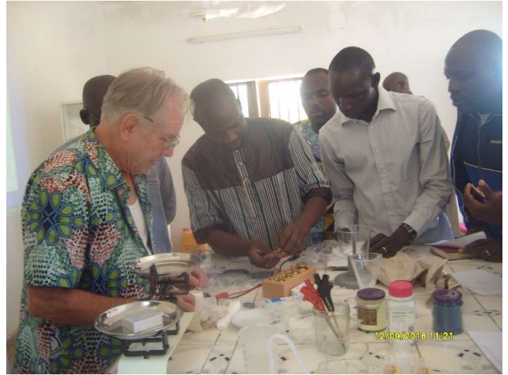
Remise du matériel d'expérimentation au collège