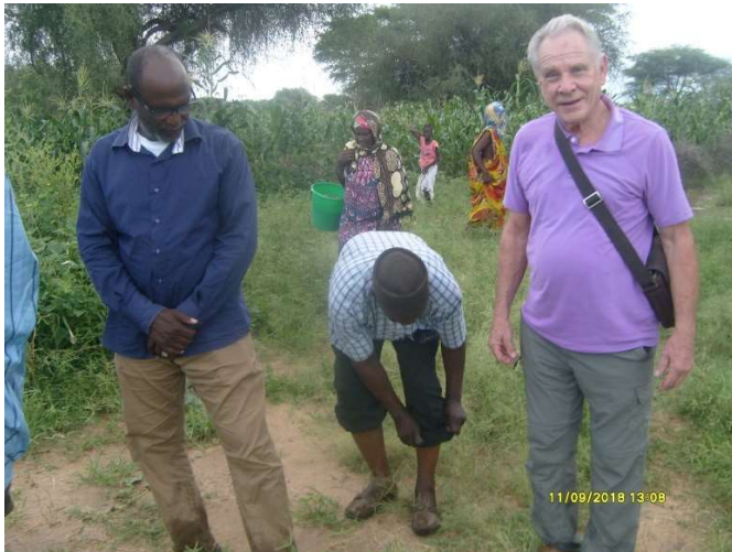
Djanwelly : que d'eau !!