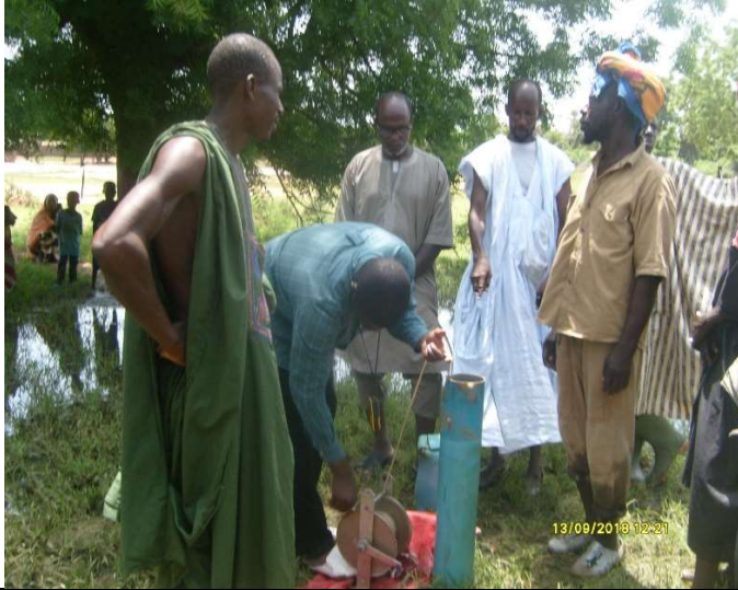
Madonga : mesure du niveau de la nappe -13 m