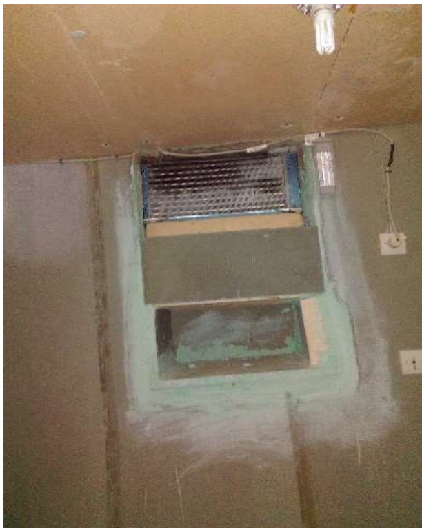
L'intérieur : vue de la grille de réfrigération et de la prise d'air