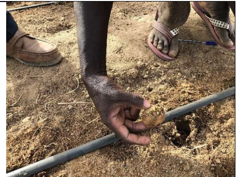
Production des semences G3 à Nioro Sokhodé Avec G2 vendues par l'IPR