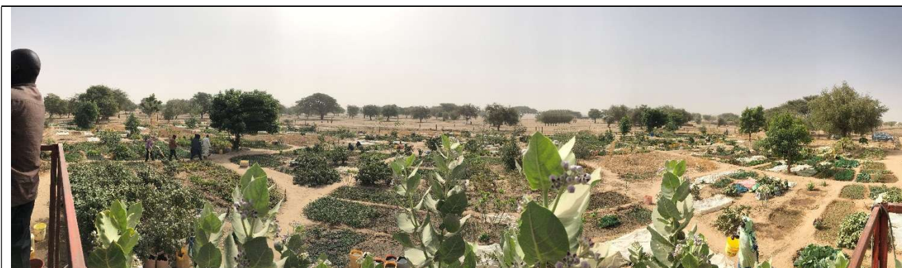
Vue du château d'eau