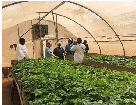
Production des semences G1 IPR Katibougou