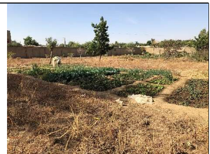
Parcelle d'Aminata Diallo