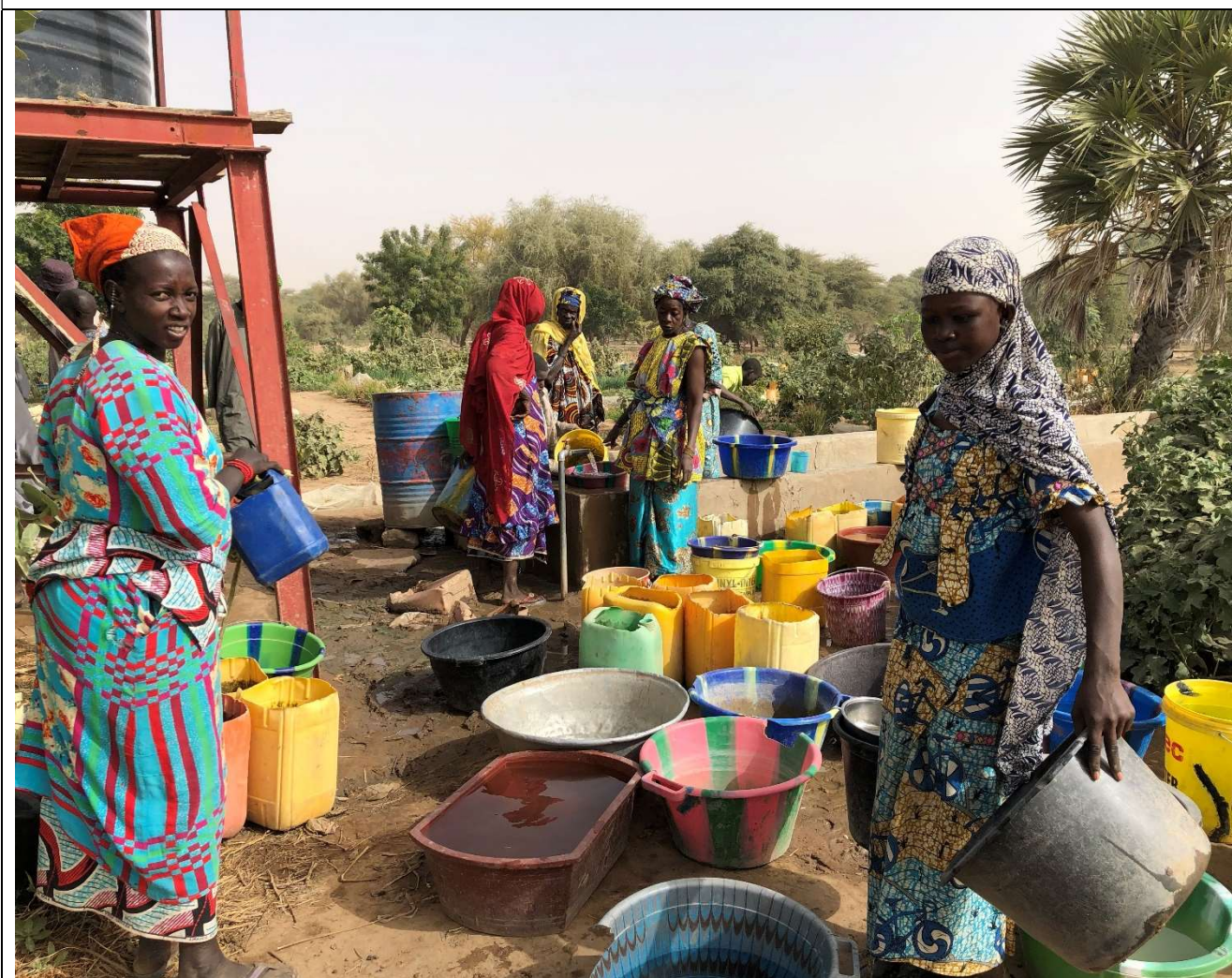
Remplissage des bassines au seul robinet qui donne l'eau