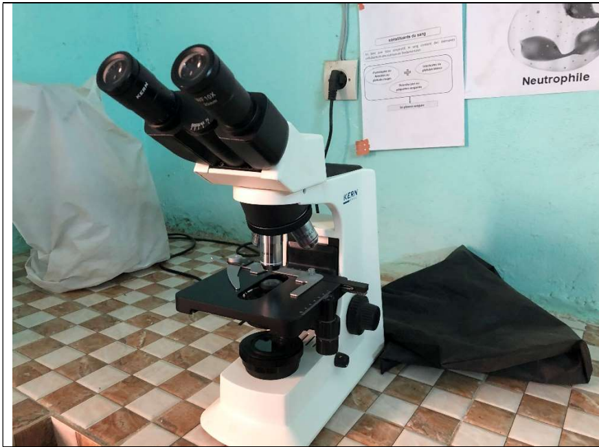
Le microscope livré en 2018