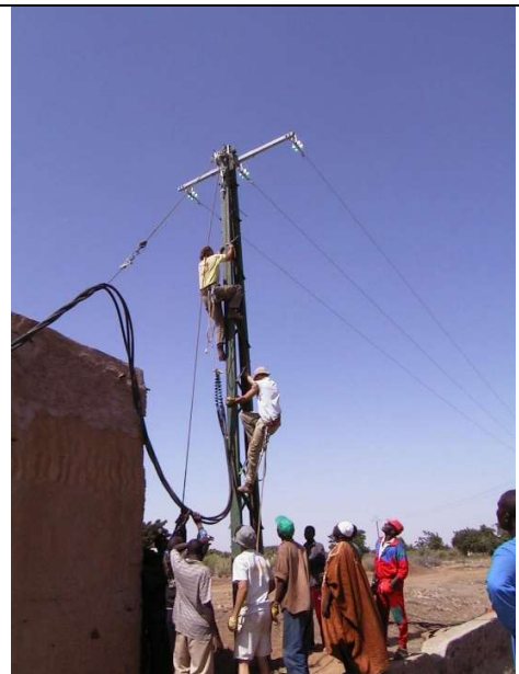
L'électrification de Nioro en 2004