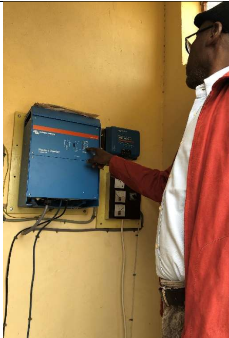
Le convertisseur Victron 5000