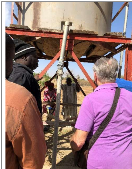
Cuve percée de Malicounda