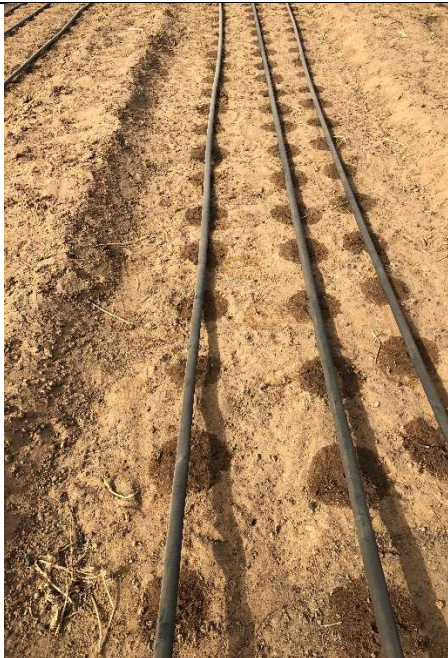
L'impact du goutte à goutte