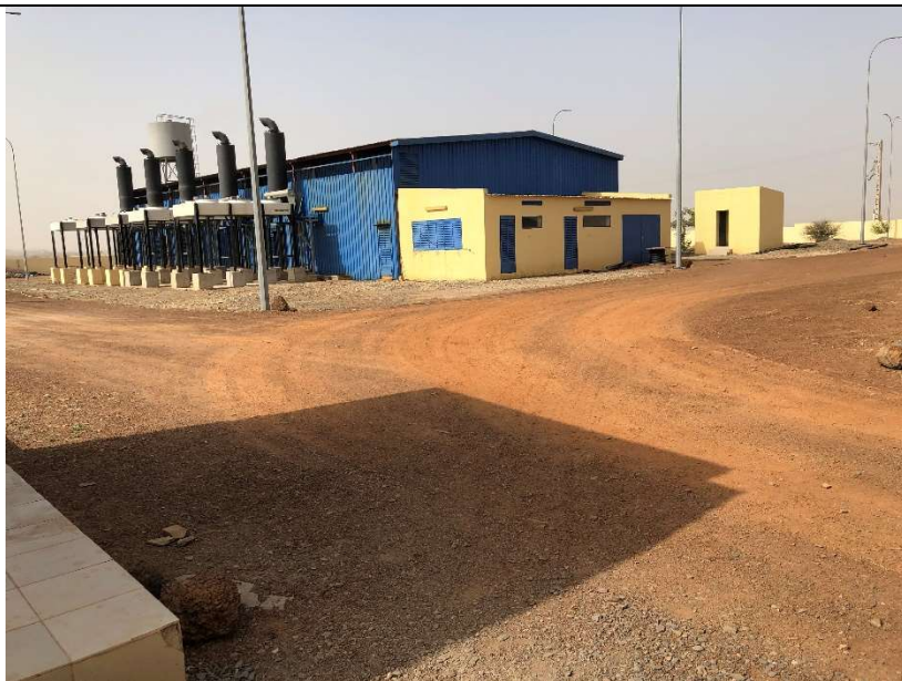
La centrale de Nioro du Sahel, 18/02/20

Aujourd'hui, la centrale thermique de Nioro compte cinq groupes : 3*1400 kVA et 2*1200 kVA dont deux à démarrage électrique et trois à démarrage pneumatique (30 bars d'air pour le démarrage) comportant huit(08) cylindres par groupe. La capacité de stockage de combustible de la centrale est de 200 m 3 , la consommation est de 13 500 litres/jour en saison chaude. Il y a trois départs de courant de la centrale actuellement. Un départ est destiné à la ville de Nioro et le second pour des villages environnants. Le troisième est en réserve. La puissance était de 2 373KW à l'heure de notre passage, la tension d'entrée dans les transformateurs est de 400V tandis que la tension de sortie est de 15 000V.