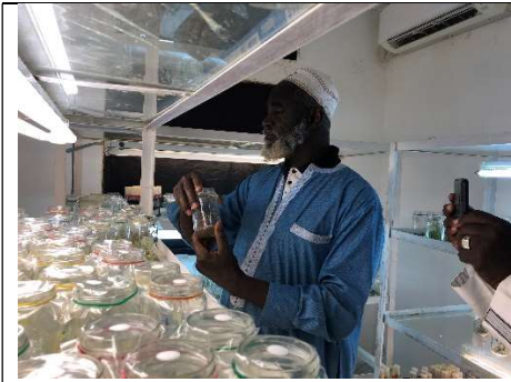
Production des semences G0 in vitro . IPR Katibougou