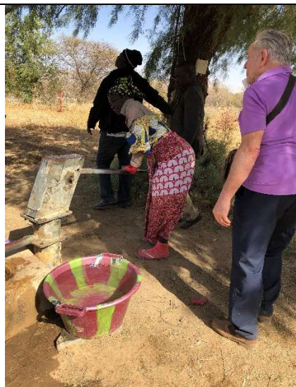
Réinstallation de la pompe manuelle